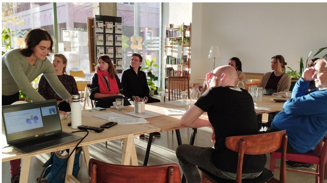
Abb. 12: KLIMASALON Workshop mit „klimaaktiv

Das Programm lebt von den Beiträgen vieler Kooperationspartnerinnen, für die der KLIMASALON eine Plattform bietet, ihre Veranstaltungsformate durchzuführen und als eigenständige Akteur:innen wahrgenommen zu werden und sichtbar zu bleiben.