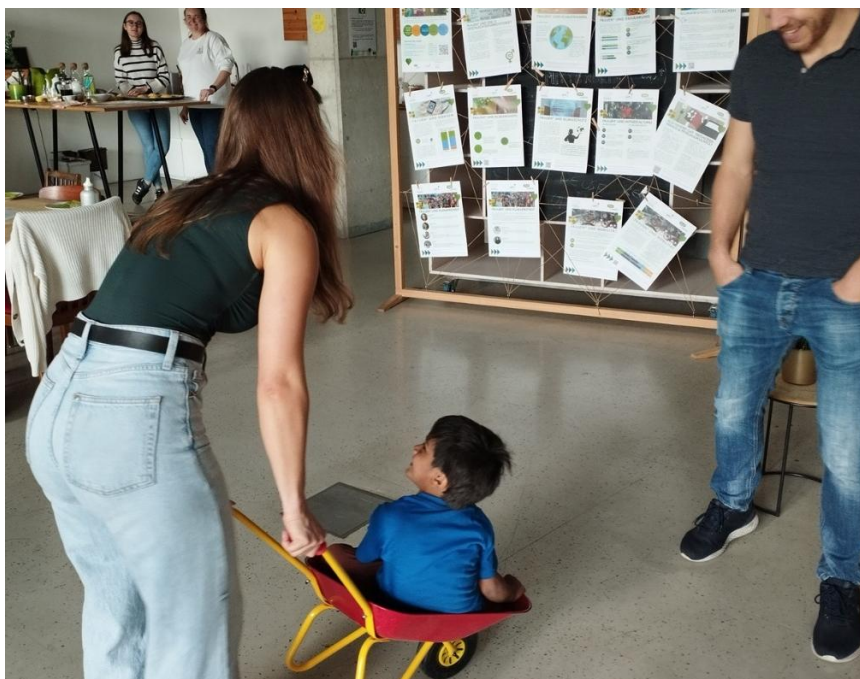
Abb. 17: Groß und klein gemeinsam im Treffpunkt vor.ort