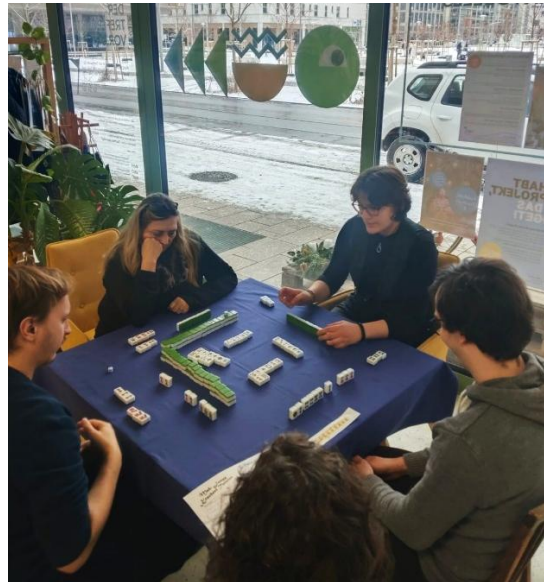
Abb. 20-24: Autoren-Lesung „Jagdrausch“, Spielenachmittag im Nikolaus Harnoncourt Park, „Let's Dance“ und Mah Jongg Spielen