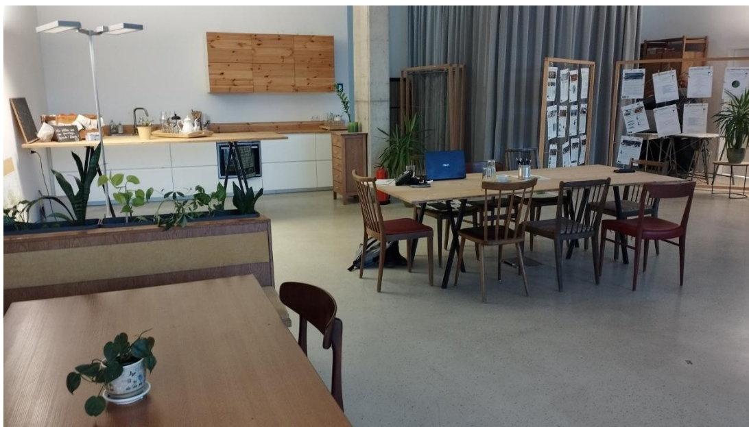
Abb. 1: Der Treffpunkt vor.ort als Info- und Anlaufstelle und Ort für nachbarschaftliche Begegnung

Darüber hinaus stand das Jahr 2025 ganz im Zeichen einer umfangreichen Evaluation der SmartCity Stadtteilentwicklung. Im Rahmen des Projektes „Klima-Pionier-Quartier“ wurden in den Bereichen Soziales, Grün- und Freiräume, Mobilität und Energie umgesetzte Maßnahmen und durchgeführte Entwicklungs-, Planungs-, Umsetzungs-, und Betriebsphasen reflektiert.