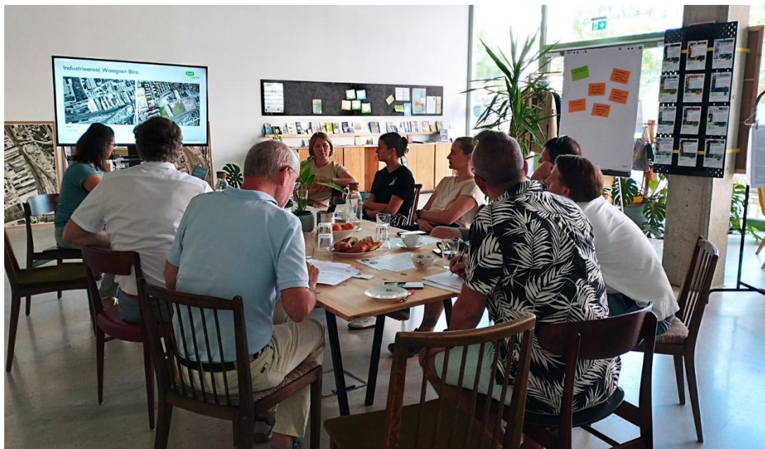
Abb. 7: Stadtteil-Stammtisch mit lokalen Unternehmerinnen, Organisationen und Initiativen

Für und mit lokalen Unternehmer:innen, Organisationen und Initiativen wurde ein Stammtisch ins Leben gerufen, um den Austausch zu stärken, gemeinsame Anliegen zu formulieren, Synergien zu nutzen und Aktivitäten im Stadtteil anzustoßen. Das Stadtteilmanagement vor.ort stellt dafür Räume zur Verfügung und unterstützt die Vernetzung und gemeinsame Anliegen. Im Jahr 2025 fand der Stammtisch dreimal statt und wurde von den Beteiligten positiv aufgenommen. Eine Fortsetzung im Jahr 2026 ist geplant. Zudem ist für das Frühjahr 2026 ein gemeinsames Stadtteilfest in Vorbereitung.