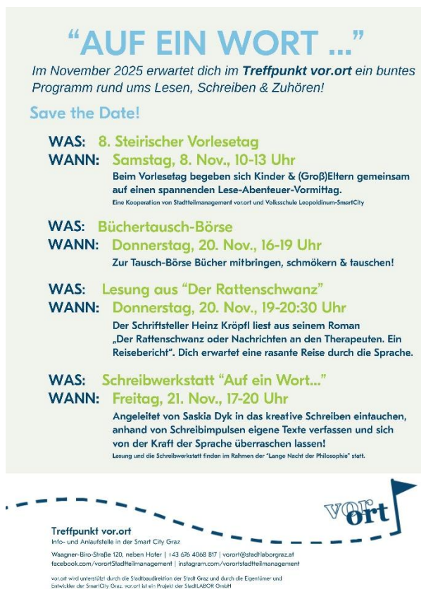
Abb. 18: Programmübersicht „Auf ein Wort“