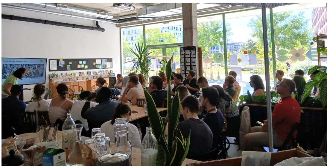
Abb. 10: Besuch von Studierenden und Lehrenden im Treffpunkt vor.ort

Im Rahmen des Projekts entstand ein kollektiver, achtsamer Moment im öffentlichen Raum, in dem Pflanzen, Menschen und Ort in einen feinen Dialog traten. Ziel war es, den Stadtraum nicht nur zu gestalten, sondern ihn bewusst anders zu lesen, zu erleben und neue Potenziale sichtbar zu machen.