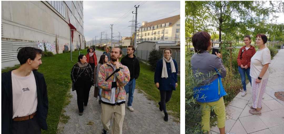
Abb. 8, 9: Stadtteilbegehung und Blühwiesenspaziergang

Das Stadtteilmanagement verlagerte im Jahr 2025 themenspezifische Stadtteilinformationen in Aktivitäten und Angebote des KLIMASALON und konnte in dem Zusammenhang Inhalte zu den Schwerpunkten sanfte Mobilität, Energie, Grün- und Freiräume in neue Formate integrieren. So boten z.B. die einmal im Monat stattfindenden Spaziergänge („KLIMASALON: Spazierwege erkunden“) einen passenden Rahmen, um neben dem Bewegungsaspekt die Mobilitätsinfrastruktur und die Grün- und Freiräume in der SmartCity kennenzulernen. Das Format „Umsteigen, bitte“ des KLIMASALON Kooperationspartners Prime Mobility , thematisierte den Umstieg auf öffentliche Verkehrsmittel und Car-Sharing Optionen mit Bewohner:innen in der SmartCity. Im Rahmen des „KLIMASALON: Pflanzenstammtisch“ sowie „KLIMASALON: Blühwiesenspaziergang“ mit der Natur.Werk.Stadt wurden lokale Grünräume mit einem starken Blick auf die Bepflanzung untersucht. Bei Energieberatungen mit dem KLIMASALON Kooperationspartner Caritas wurden die Möglichkeiten des Energiesparens in Gebäuden in der SmartCity genauer beleuchtet. Die Veranstaltung FORUM URBANES GRÜN thematisierte Bauwerksbegrünungen in der SmartCity.