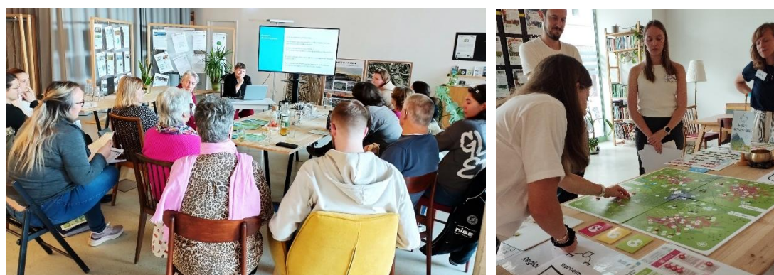
Abb. 14-16: KLIMASALON „Klima-Pakt Kochworkshop“, Energieberatung und „Klimaplanspiel“