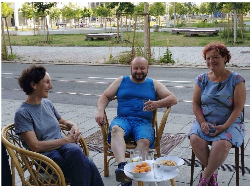
Abb. 2: Austausch mit Nachbar:innen im Vorbereich des Treffpunkt vor.ort

Im Rahmen von zwei wöchentlichen Öffnungszeiten, „Café vor.ort“ immer dienstags und donnerstags von 14 bis 18 Uhr lädt das Stadtteilmanagement vor.ort zum persönlichen Austausch mit Bewohner:innen, Anrainer:innen und Interessierten ein. Zusätzlich zu den Öffnungszeiten können auch individuelle Termine vereinbart werden.