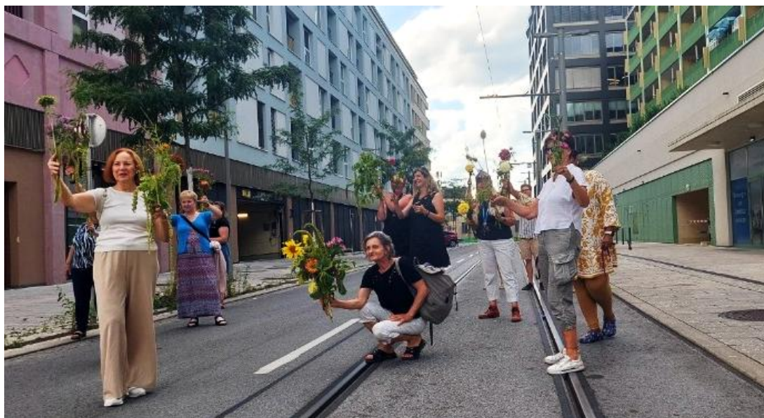
Abb. 11: IKEBANA in der SmartCity