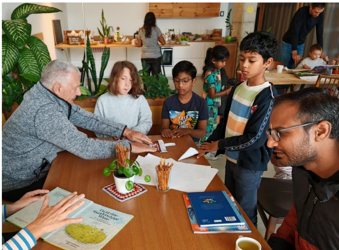
Abb. 19: „Steirischer Vorlesestag“