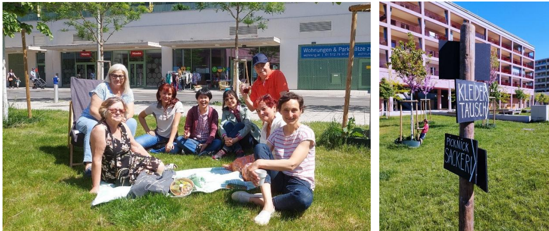
Abb. 25, 26: Picknick im Nikolaus Harnoncourt Park im Rahmen des Lendwirbel

Das abschließende Programm mit Begehung am Mariahilferplatz, Podiumsgespräch und Ausstellung im Space04 des Kunsthaus bot weitere Impulse und Raum für Austausch mit Expert:innen.