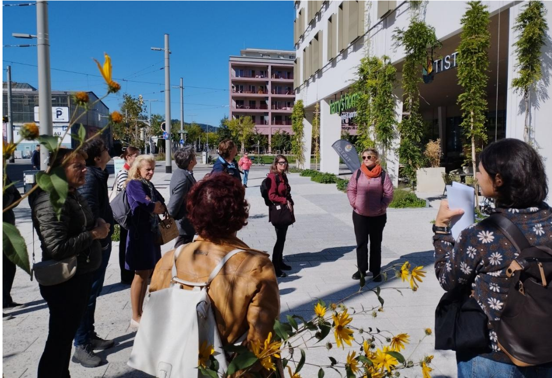
Abb. 27: Exkursion FORUM URBAN GREEN