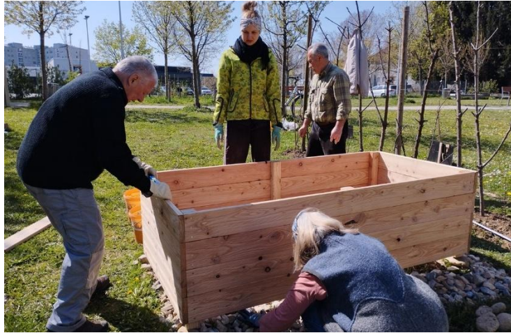
Abb. 28: Hochbeet aufstellen mit dem Gemeinschaftsgarten Vielfalter Ausblick 2026