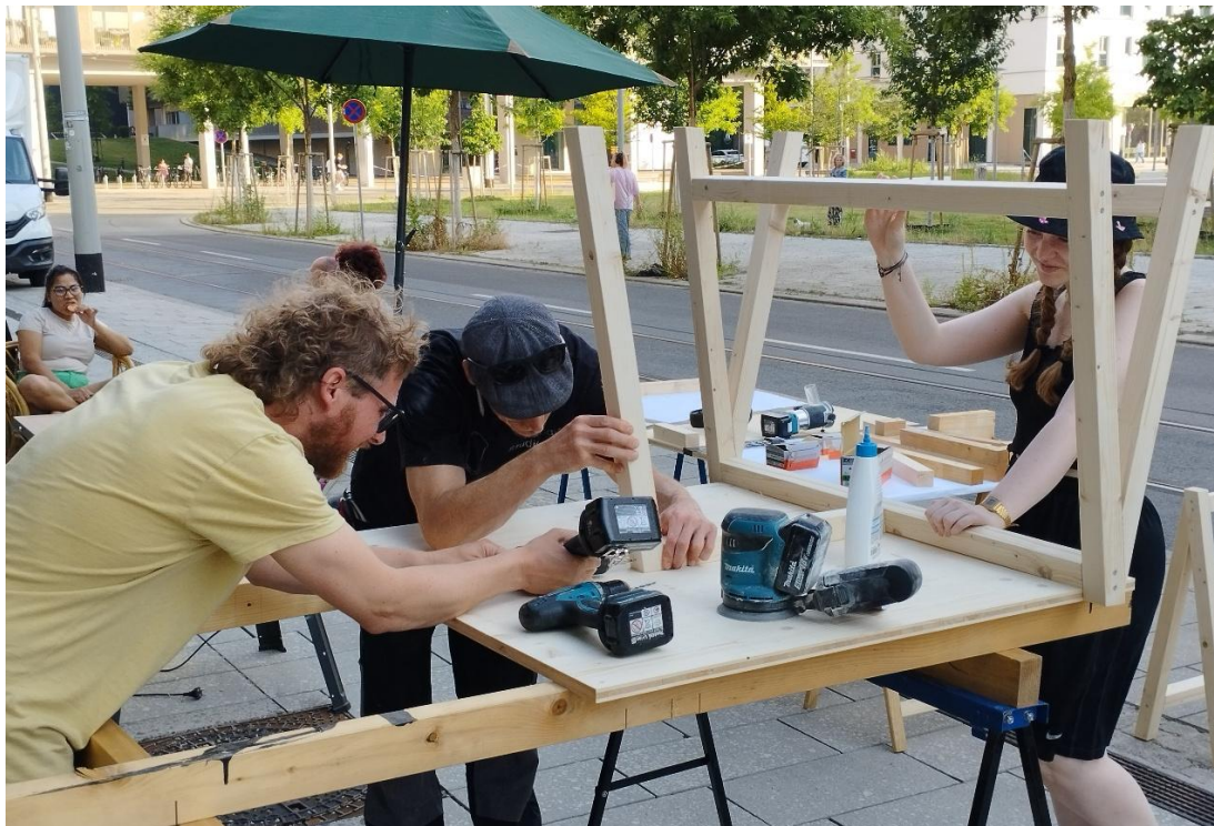
Abb. 13: KLIMASALON „Klima-Tisch“ bauen mit studiomatic

Zum Abschluss der ersten Phase des KLIMASALON fand ein Reflexions-Workshop mit klimaaktiv in der SmartCity Graz statt, zu dem alle Kooperationspartner:innen eingeladen waren. Der KLIMASALON wird im Jahr 2026 weiter fortgesetzt, neue Kooperationspartner:innen sind willkommen!