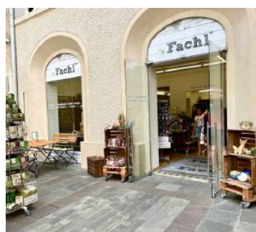
Bis Mai werden die Geschäftsflächen saniert und adaptiert.