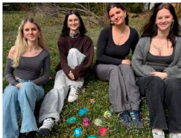
Die vier Schülerinnen und ihre „Glückssteine“. HLW Sozialmanagement Graz